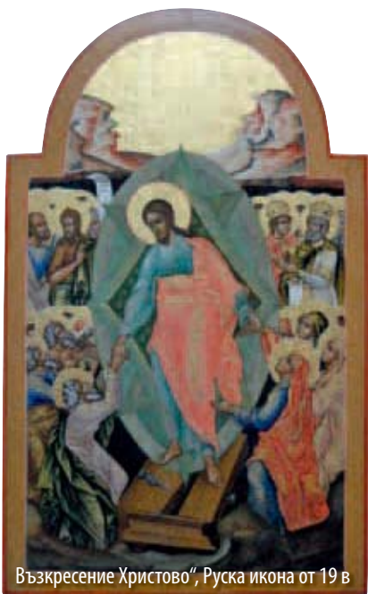
„Възкресение Христово“, Руска икона от 19 в