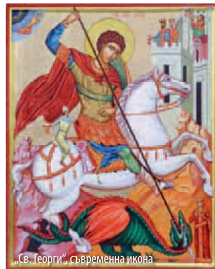
„Св. Георги“, съвременна икона

Св. Георги е роден в Кападокия, в богато и благородническо семейство по времето на император Диоклетиян, един от най-яроствните гонители на християните. Още съвсем млад Георги, получава висока воинска длъжност. Очаква го блестящо бъдеще, но той пренебрегва земната слава и открито заявява своята вяра в християнския Бог. Подложен е на жестоки мъчения, които с Божията помощ понася мъжествено. Виждайки непоклатимата му вяра, мнозина от императорския двор се покръстват. Сред тях е и съпругата на Диоклетиян – Александра. Разгневен, владетелят заповядва Георги да бъде