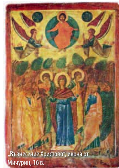
„Възнесение Христово“, икона от Мичурин, 16 в.

Спасовден е празник на хлебари, шофьори, строители, хотелиери и цветари. Според народните схва-