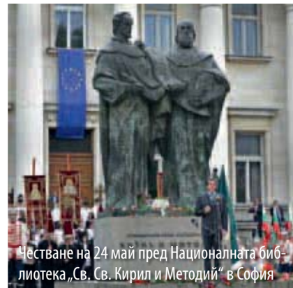
Честване на 24 май пред Националната библиотека „Св. Св. Кирил и Методий“ в София

С написания от Стоян Михайловски всеучилищен химн „Кирил и Методий“, честването влиза в кръвта на всеки българин още от ученическата скамейка.