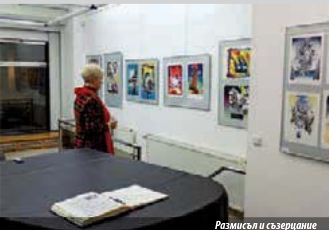
Размисъл и съзерцание