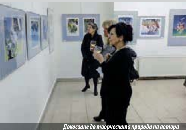
Докосване до творческата природа на автора