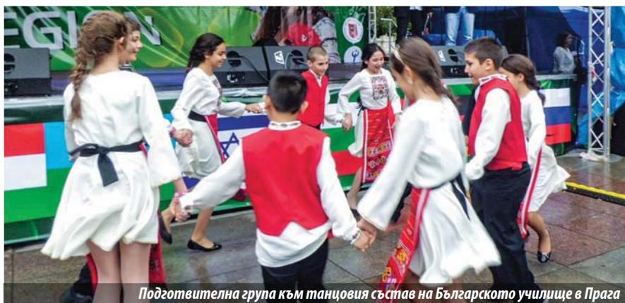
Подготвителна група към танцовия състав на Българското училище в Прага

на на публиката. Момчето с изящна виртуозност изпълни солова хореография – български народен танц и след това с охота сподели за увлечението си по българския фолклор.