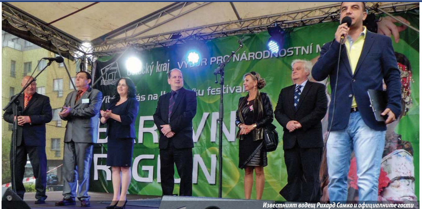
Известният водещ Рихард Самко и официалните гости