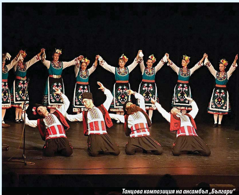
Танцова композиция на ансамбъл „Българи“

В периода 24 – 26 октомври в театъра на Хорни Почернице се състояха „Дни на българската култура“. Събитието е в рамките на юбилейния, десети по ред цикъл „Опознай страните на Европейския съюз“. За участие в една от тържествените вечери бе поканен и ансамбъл „Българи“.