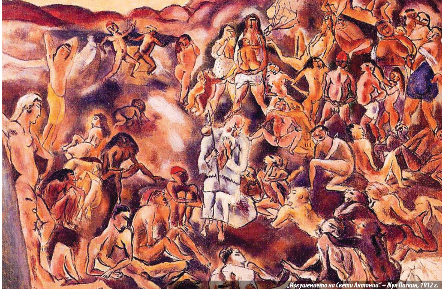
„Изкушението на Свети Антоний“ – Жул Паскин, 1912 г.

е силна, но впоследствие разрушителна. За последен път, през 1913 г., е в Букурещ за погребението на майка си, като окончателно прекъсва връзките със семейството си.