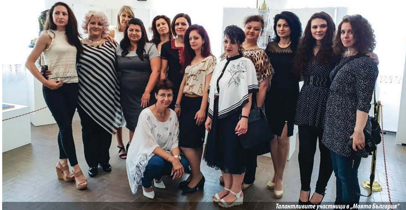
Талантливите участници в „Моята България“

От 24 май до 11 юни, в галерия „Тихото гнездо“ на ДКИ КЦ „Двореца“, гр. Балчик бе представен проектът-колаборация „Моята България“ – изложба от захарни творения, пресъздаващи българската история, култура, бит и архитектура. Мястото за осъществяването на уникалната експозиция е подбрано с усет за ситуацията, а началото на летния сезон дава възможност на много чуждестранни туристи да се насладят на българските майстори-декоратори.