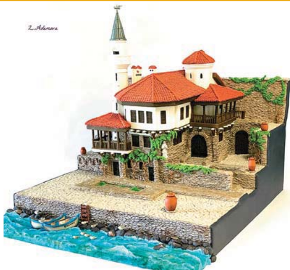
„Дворецът в Балчик“, Зюбейра Адемова