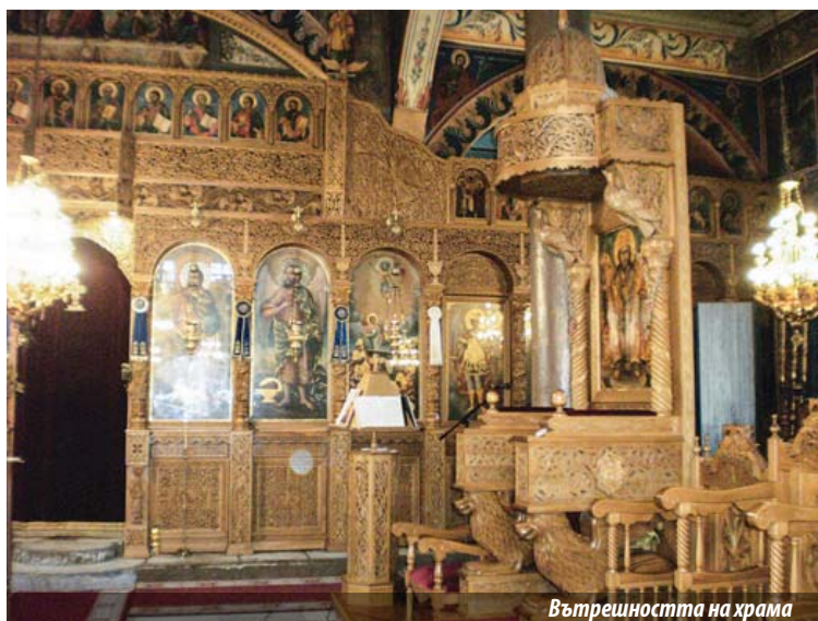
Вътрешността на храма

приети или приети повиквания по телефона, което означава, че има нещо – навик. Животът на църквата е строго определен от векове, богослужбният цикъл е измислен от векове, ние само го спазваме. Има ежедневен богослужбен цикъл, седмичен богослужбен цикъл, месечен и годишен. Ние нямаме друг начин, освен да се движим около това. Всичко е свързано с празниците, които пред-