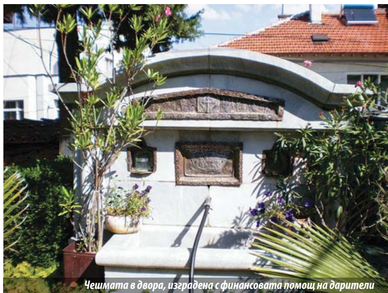
Чешмата в двора, изградена с финансовата помощ на дарители