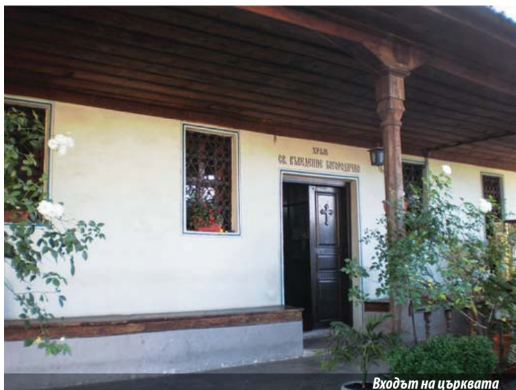
Входът на църквата

А. М.: (смее се) Ежедневието е динамично, не знам дали си могъл да го видиш, да го усетиш. Ако те взема един ден с мене, ще имаш друго впечатление и щеше да ми е приятно да бъдем цял ден заедно, да видиш колко сме динамични, колкото и да изглеждаме отстрани като така леко заспала институция. Напротив, не е така. От сутринта съм станал в пет и половина и имам към 30 не-