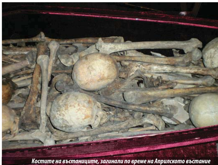
Костите на въстаниците, загинали по време на Априлското въстание

сленето на тогавашното общество, променило е основите на всички догми, канони, ценности, и всички се стремим към възкресението, което Христос проповядва и ни остави, за да може чрез надеждата да се докоснем до него и да го изживеем, ако Бог е милостив към нас, към нашите грехове, да наследим живот вечен. Църквата не може да променя своите послания в годините. Друг е въ-