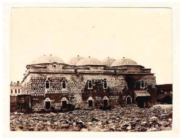
Буюк джамия – първата сграда на Народната библиотека, в която тя се помещава в периода 1880–1885 г.