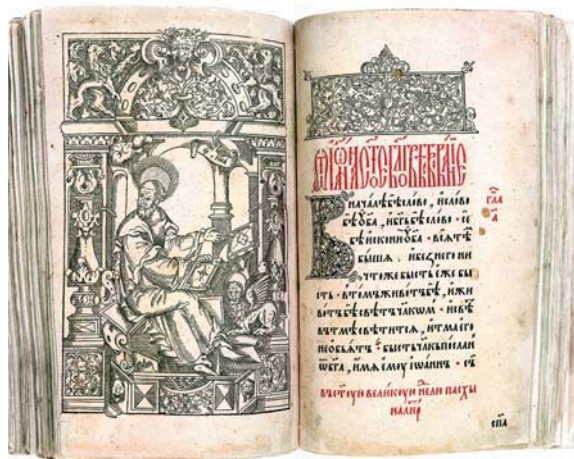
Четвероєвангелие. Вилнюс, изд. и печ. Петър Мстиславец, 1575 г.

– Н. Б.: Само в София или и на други места в България се намират фондовете на Националната библиотека?