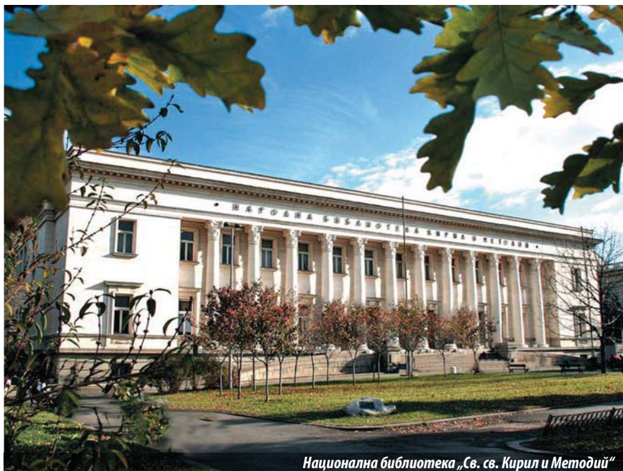
Национална библиотека „Св. св. Кирил и Методий“