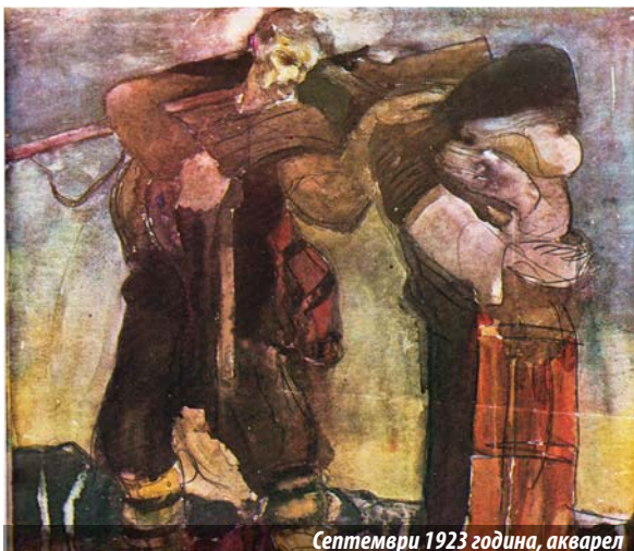
Септември 1923 година, акварел