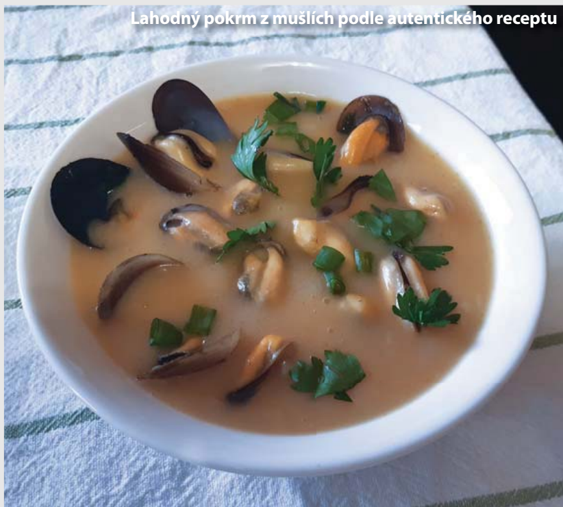
Lahodný pokrm z mušlí podle autentického receptu

Žádná návštěva severního pobřeží Černého moře se nemůže obejít bez degustace mušlí na mušlí farmě Dalboka v obci Balgarevo. Pěstují se zde ekologicky čisté černomořské mušle, které jsou známé svými blahodárnými účinky na zdraví a kvalitní chutí. Na pláži nad zálivem se nachází speciální