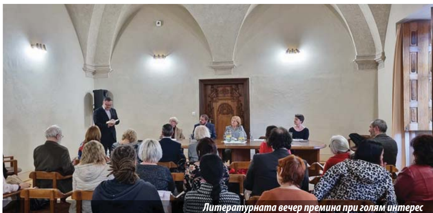
Литературната вечер премина при голям интерес