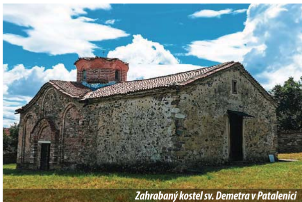
Zahrabaný kostel sv. Demetra v Patalenici

Ž il byl jeden pasáček. Každé ráno ještě před východem slunce vodil své stádo na pastvu. Jednoho večera se však rozpoutala strašlivá bouře. Přívalový déšť zaplavil pole. Stromy se pod silným větrem celé rozhoupaly. Nebe černé jako dehet bylo rozsápáno blesky. Po svazích Rodop se rozléhalo hromobití. Brzy z rána bouře přestala a pasáček znovu vyvedl stádo. Na konci vsi byl vysoký kopec a na jeho vršku čněl starý strom. Stalo se, že toho samého rána pasáček šel kolem kopce, a když se podíval nahoru, co neviděl – velký strom byl tou strašnou bouří úplně vyvrácený. Pasáček vyšplhal na vršek kopce a tam spatřil v zemi velkou zející díru. Vystrašeně přistoupil až na samý okraj díry a zevnitř uviděl tváře, jak číhají a pozorují jej. Pasáček se vylekal, skutálel se z kopce a pelášil rovnou do vsi. Přišli i vesničané a také oni se jali do díry nakukovat. A v tom si jeden ze starších vzpomněl na prastarý příběh, který mu vyprávěl jeho dědeček, když byl ještě malý kluk – příběh o kostelu zahrabaném