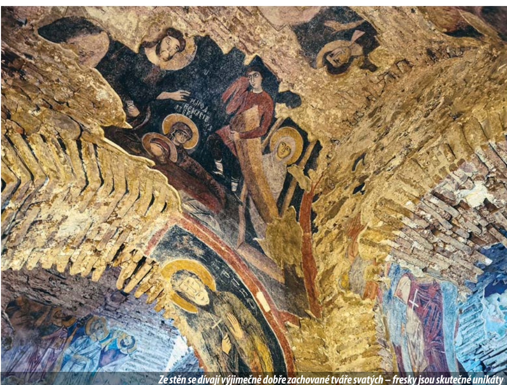
Ze stěn se dívají výjimečně dobře zachované tváře svatých – fresky jsou skutečně unikáty

Samotný kostel byl postaven z nepravidelných řad říčních kamenů a tufu a z třech až pěti řad cihel, klenby a oblouky jsou výlučně cihlové. Stavba má na šířku 9 m a 57 cm, na délku 10 m a 92 cm a výška bez kupole je kolem 6,5 m. Chrám má křížovou klenbu se čtyřmi podpůrnými sloupy pod klenbou ve tvaru obráceného