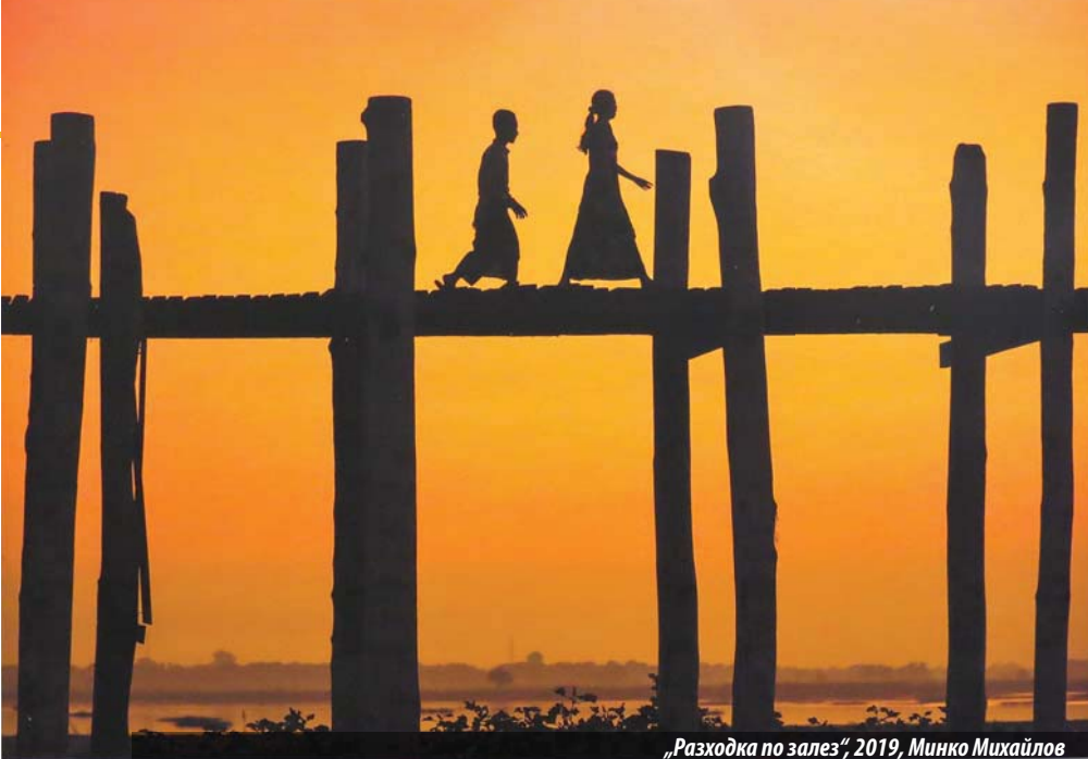
„Разходка по залез“, 2019, Минко Михайлов