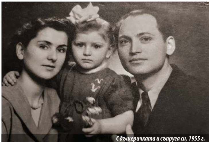
Сдъщеричката и съпруга си, 1955 г.