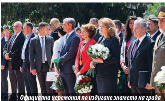
Официална церемония по издигане знамето на града