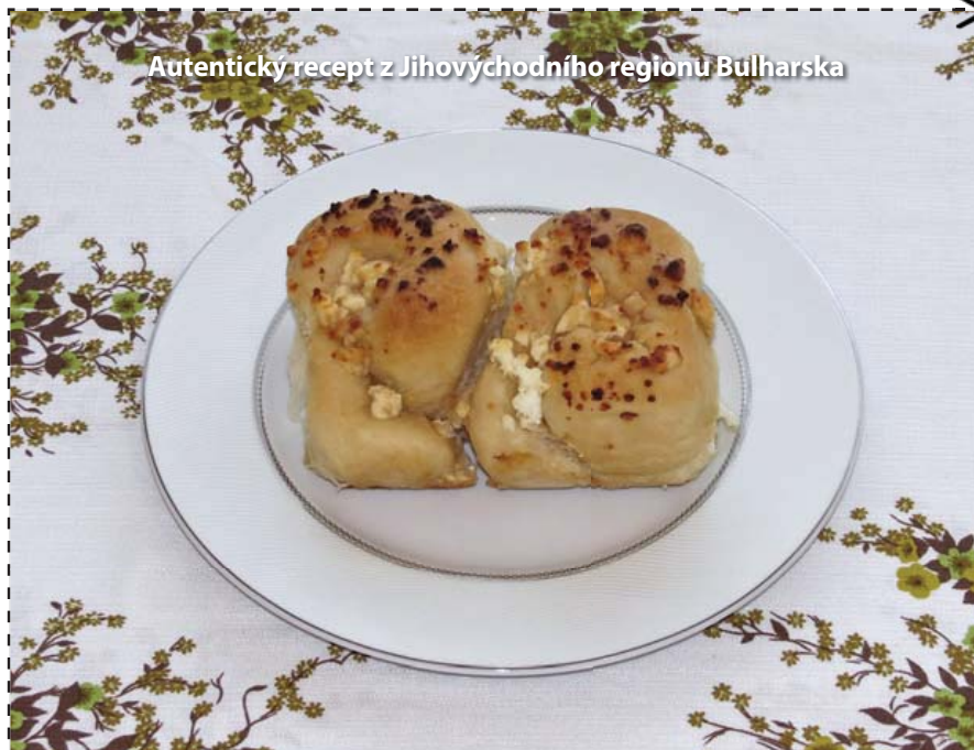
Autentický recept z Jihovýchodního regionu Bulharska