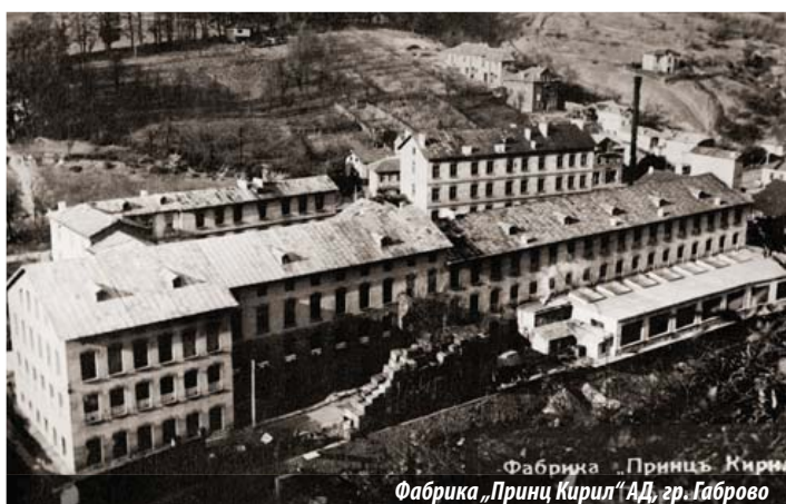
Фабрика „Принц Кирил“ АД, гр. Габрово