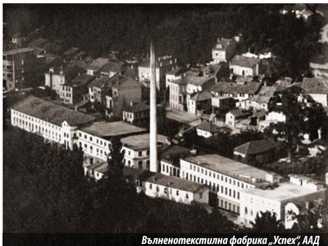
Вълнотекстилна фабрика „Успех“, ААД