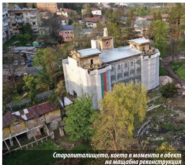
Старопиталището, което в момента е обект на мащабна реконструкция

тия се развиват впоследствие в заводи и комбинати през периода на социализма.