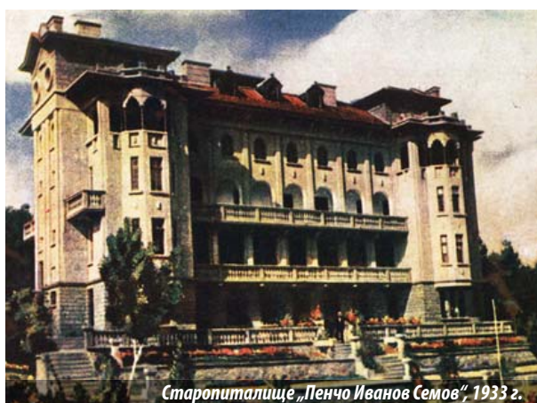
Старопиталище „Пенчо Иванов Семов“, 1933 г.