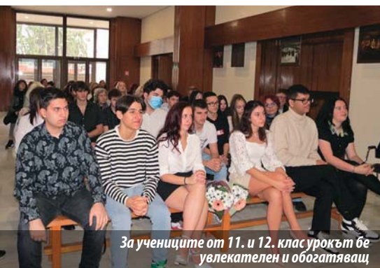
За учениците от 11. и 12. клас урокът бе увлекателен и обогатяващ