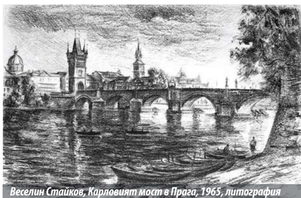
Веселин Стайков, Карловият мост в Прага, 1965, литография