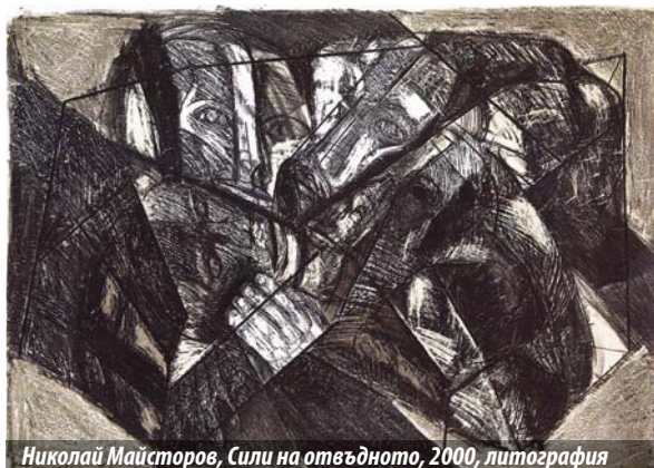
Николай Майсторов, Сили на отвъдното, 2000, литография