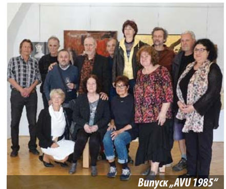
Випуск „AVU 1985“