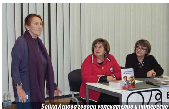
Бойка Асиова говори увлекателно и интересно