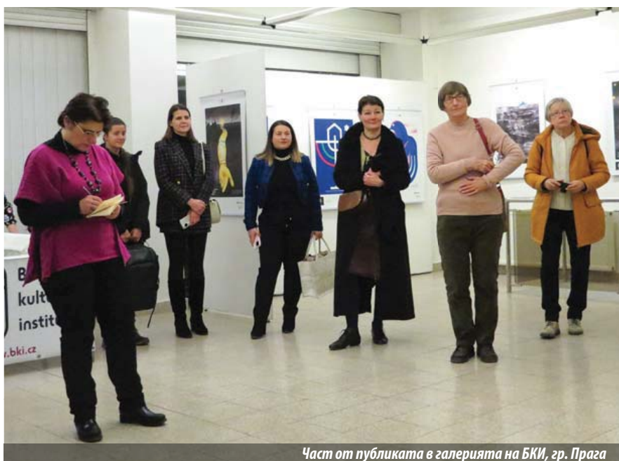
Част от публиката в галерията на БКИ, гр. Прага