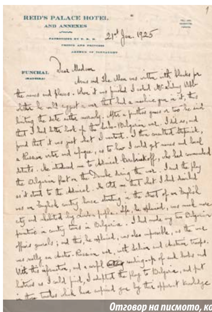
Отговор на писмото, което пише Джордж Бърнард Шоу до Анна Каменова